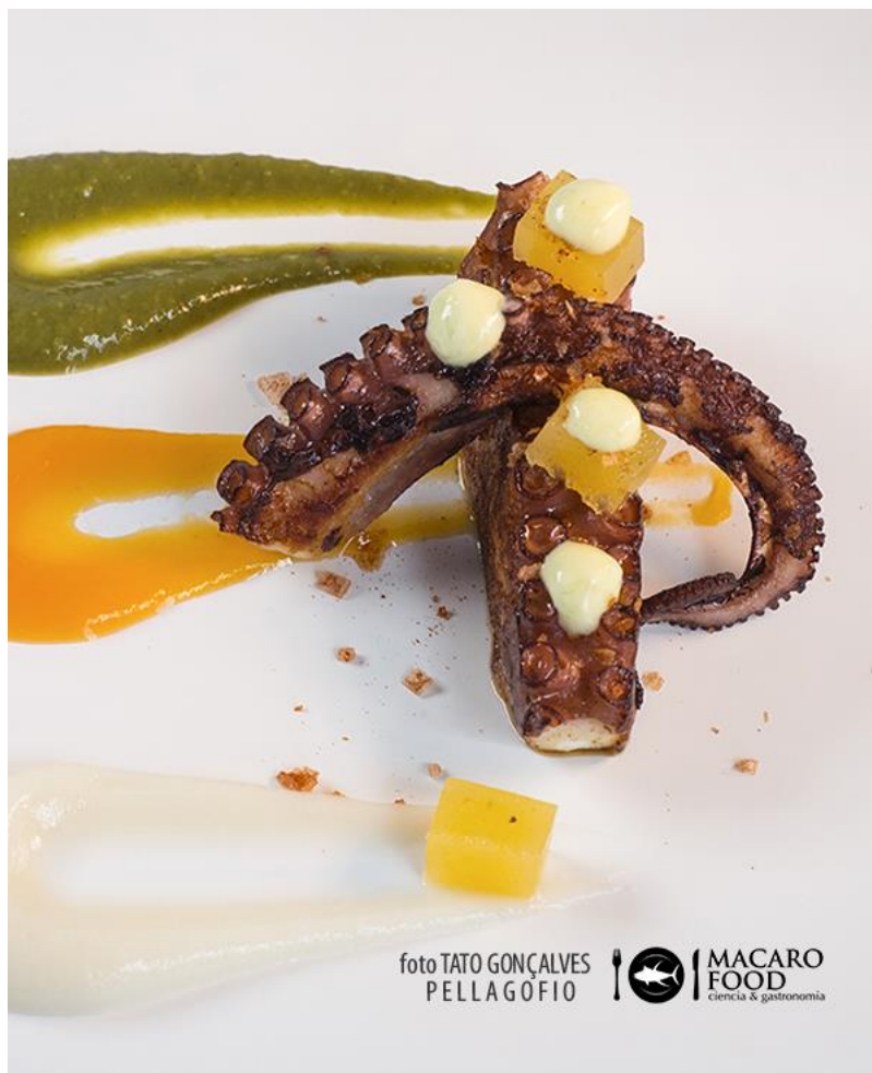
El pulpo asado con verduras

Amigo de poner nombres sencillos a sus platos, la sorpresa del “conejo deshuesado con chutney de plátanos” viene en forma de rulo horneado con un puré de papa, una salsa de Martini y unos dátiles confitados; o el “cochino negro con salsa de ñame”, resultado de una larga cocción de 12 horas a baja temperatura en la que el popular ñame (que se suele consumir guisado con un trozo de queso, o con azúcar y miel bien como postre) viene en una salsa con ron Aldea y toques de mandarina.